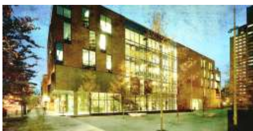
LA MAISON DU DÉVELOPPEMENT DURABLE